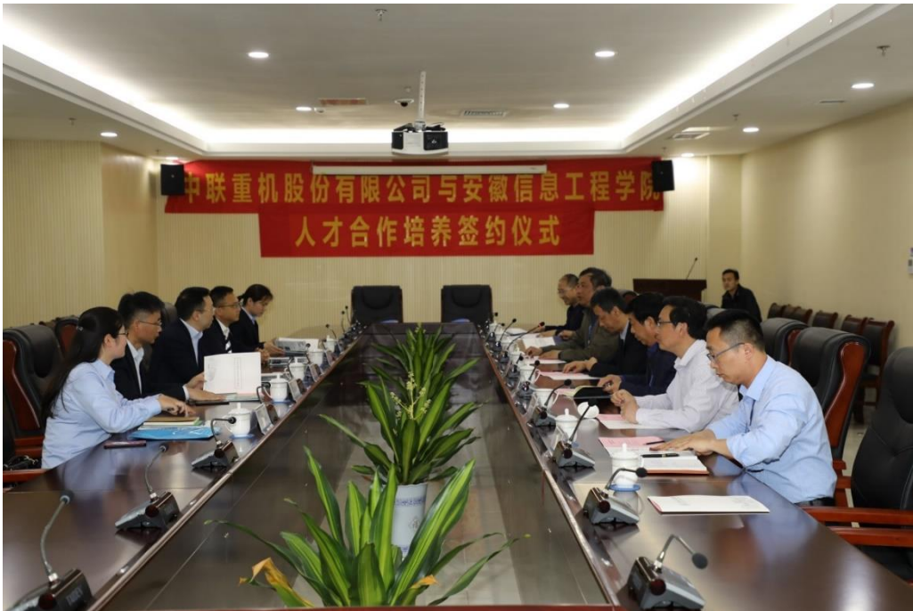
图 4 跨学科跨专业人才定制化培养

面对产业和行业发展，对人工智能与大数据、智能制造技术以及定制化产品服务的需求越来越多是社会发展的趋势，企业对跨学科复合型人才的需求越来越迫切，企业参与高校人才定制化培养是解决当前人才短缺的有效途径之一。我国农业装备领导企业中联重机为响应国家一带一路政策，拓展海外市场，迫切需要一批既懂机械工程技术，又具有经营管理和国际贸易知识的高素质海外服务工程师（产品经理），机械工程学院积极与中联重机探讨人才培养合作模式，组建以车辆工程专业学生为主，其他机械类专业学生参与的人才定向培养班，根据企业海外服务工程师岗位能力要求，开设定制化培养课程，由校企双方开展实践课程教学，首批培养的 31 名学生已开始进入企业岗位实习。