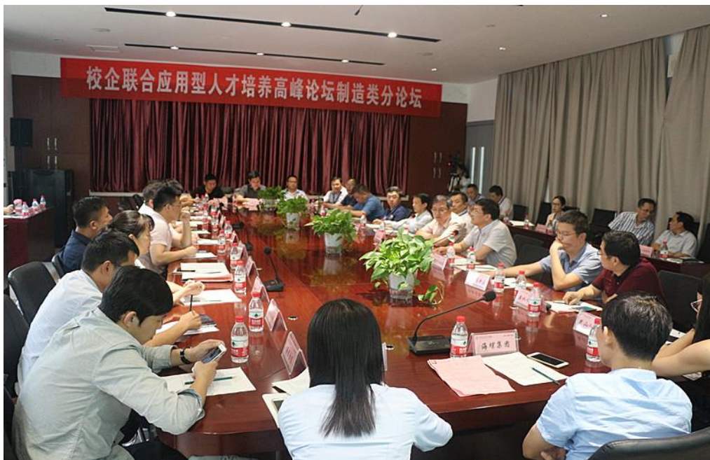
图2 校企联合应用型人才培养高峰论坛制造类分论坛会场

如何结合产业发展需要,开展实践教学课程体系建设,需要经常聆听“客户”的声音。2018年6月,安徽信息工程院校企联合应用型人才培养高峰论坛制造类分论坛在新芜校区求是楼会议室顺利举行,论坛邀请了合肥经开区、合肥新站高新区、南京溧水人社局、昆山人才中心、宜兴人社局等政府人力资源管理及人才交流分管领导,以及来自合肥京东方、国轩高科、奇瑞汽车、海螺集团、江苏远东集团、三一重机等20多家企业代表出席论坛。与会人员一致认为,应用型本科高校在人才培养方面一定要突破传统,企业对高校毕业生需求,首先看的是学生对知识掌握的程度,但更多的是看重学生将课本知识与用人单位岗位工作相结合的能力。多数高校培养的本科毕业生很难符合这一要求,“学了没有?学了;会不会应用?不会!”成为普遍现象。安徽信息工程学院构建面向行业和产业需要的实践教学课程体系,培养的学生具备企业岗位对人员素质与能力要求,符合行业 and 产业发展需要。